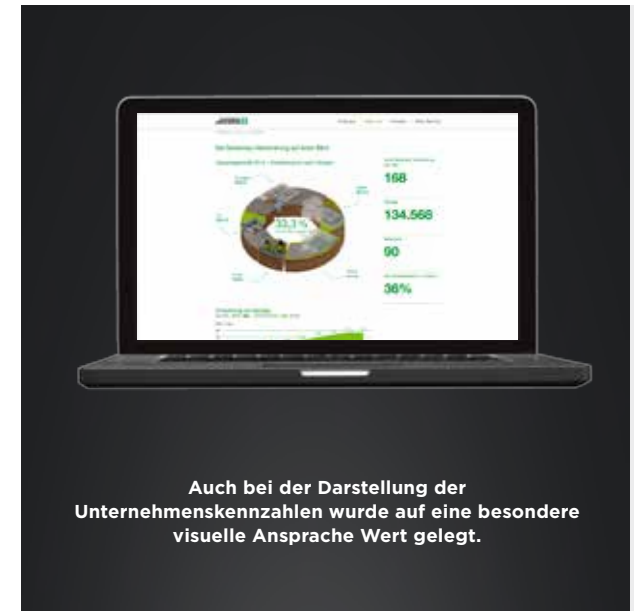
Auch bei der Darstellung der Unternehmenskennzahlen wurde auf eine besondere visuelle Ansprache Wert gelegt.