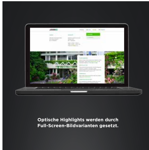
Optische Highlights werden durch Full-Screen-Bildvarianten gesetzt.

Nach unserer Überarbeitung und Neugestaltung profitiert die Gartenbau-Versicherung von einem internationalen Web-Auftritt aus einem Guss – einheitlich geführt in einem System (TYPO3). Das neue Design für die mehrsprachigen länderspezifischen Startseiten gestaltet sich aufgeräumter und großflächiger und bietet eine optimierte Nutzerführung. Dank Responsive Webdesign und interaktivem, multimedialem Mehrwert entspricht die Website nun auch den innovativen Standards.