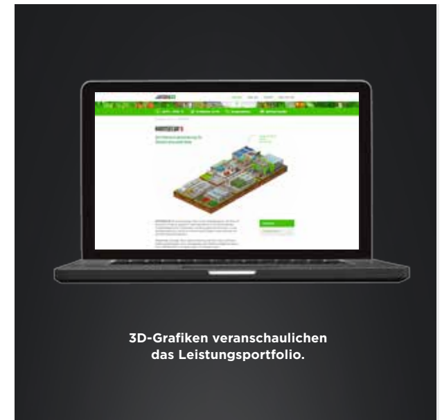
3D-Grafiken veranschaulichen das Leistungsportfolio.