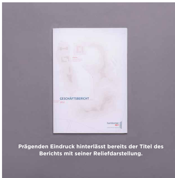
Prägenden Eindruck hinterlässt bereits der Titel des Berichts mit seiner Reliefdarstellung.

Durch den Einsatz des MPM Online Publisher wurde die Verbesserung des Workflows sofort spürbar, Produktionsprozesse beanspruchten nun deutlich weniger Zeit und Kosten. In Verbindung mit dem kreativen Konzept erhielt die HAMBORNER REIT AG so einen Geschäftsbericht, der zu ihr passt: Modern, klar und transparent stützt er den neuen Unternehmensauftritt. Ein Ergebnis, das Auftraggeber und Dienstleister gleichermaßen zufriedenstellt: Die Zusammenarbeit von HAMBORNER REIT und MPM für Geschäftsbericht und Quartalsbericht wird seither fortgesetzt.