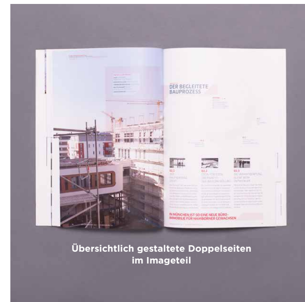
Übersichtlich gestaltete Doppelseiten im Imageteil