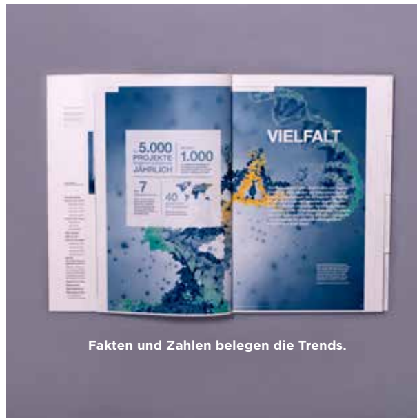
Fakten und Zahlen belegen die Trends.

Beginn der Zusammenarbeit mit euromicron