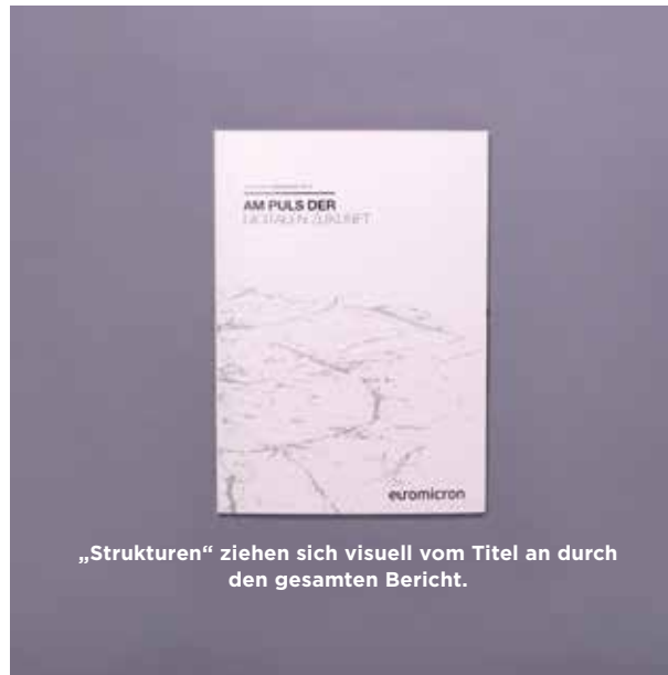
„Strukturen“ ziehen sich visuell vom Titel an durch den gesamten Bericht.

Der redaktionell betreute Imageteil mit verkürzten Seiten wurde in den Geschäftsbericht integriert und bietet viel Raum zur leserorientierten Präsentation der strategischen Themen. Zusätzlich zu Kreativkonzept und Text verantwortete MPM auch Design, Layout und die Produktion des Geschäftsberichts.