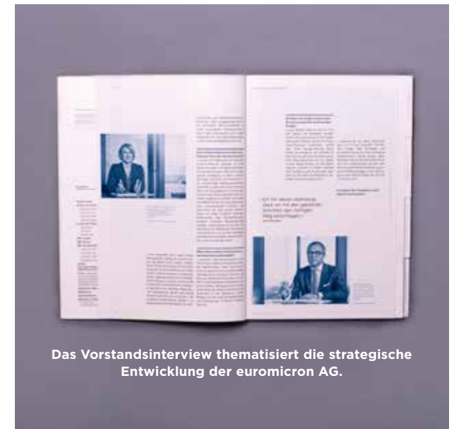
Das Vorstandsinterview thematisiert die strategische Entwicklung der euromicron AG.