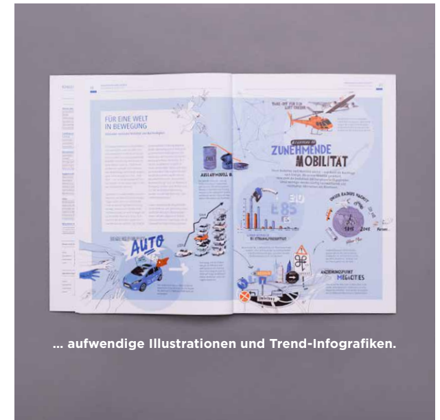
... aufwendige Illustrationen und Trend-Infografiken.