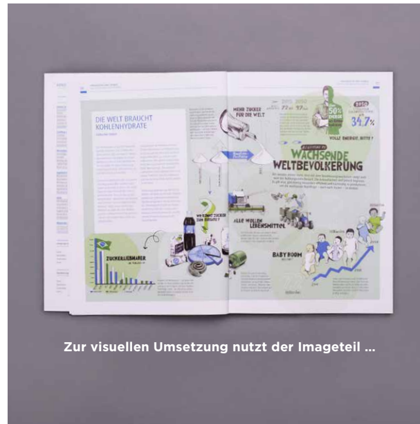
Zur visuellen Umsetzung nutzt der Imageteil ...

Für den Geschäftsbericht 2014/15 entschied sich Südzucker für ein mutiges Konzept und konnte einen neuen Maßstab in seiner Berichtsgestaltung setzen. Mit einem ungewöhnlichen, aufmerksamkeitsstarken Titel erreicht der Bericht die Stakeholder. Die sympathischen, überraschenden und gleichzeitig intelligent-witzigen Illustrationen eignen sich ideal dazu, das zentrale Zukunftsthema visuell umzusetzen. Dieser Mut von Südzucker zu einem illustrativen Bericht wurde nicht nur mit einer qualitativ hochwertigen Umsetzung durch das MPM-Kreativteam belohnt, sondern auch mit einem hervorragenden Ergebnis in den internationalen Awards-Wettbewerben, unter anderem mit Gold bei den Galaxy Awards, Silber bei den Fox Finance Awards und einem Award of Excellence bei den International Corporate Media Awards.